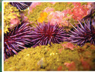
Erizos morados Strongylocentrotus purpuratus