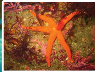
Estrellas de mar Echinaster sepositus