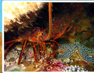
Langosta roja Panulirus interruptus