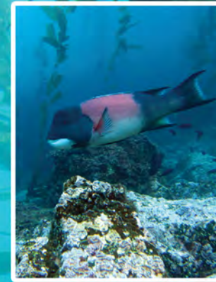
Vieja Californiana Semicossyphus pulcher