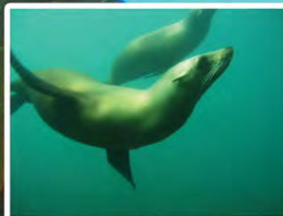
Focas marinas Zalophus californianus