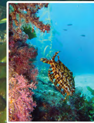
Molva pinta Oxylebius pictus